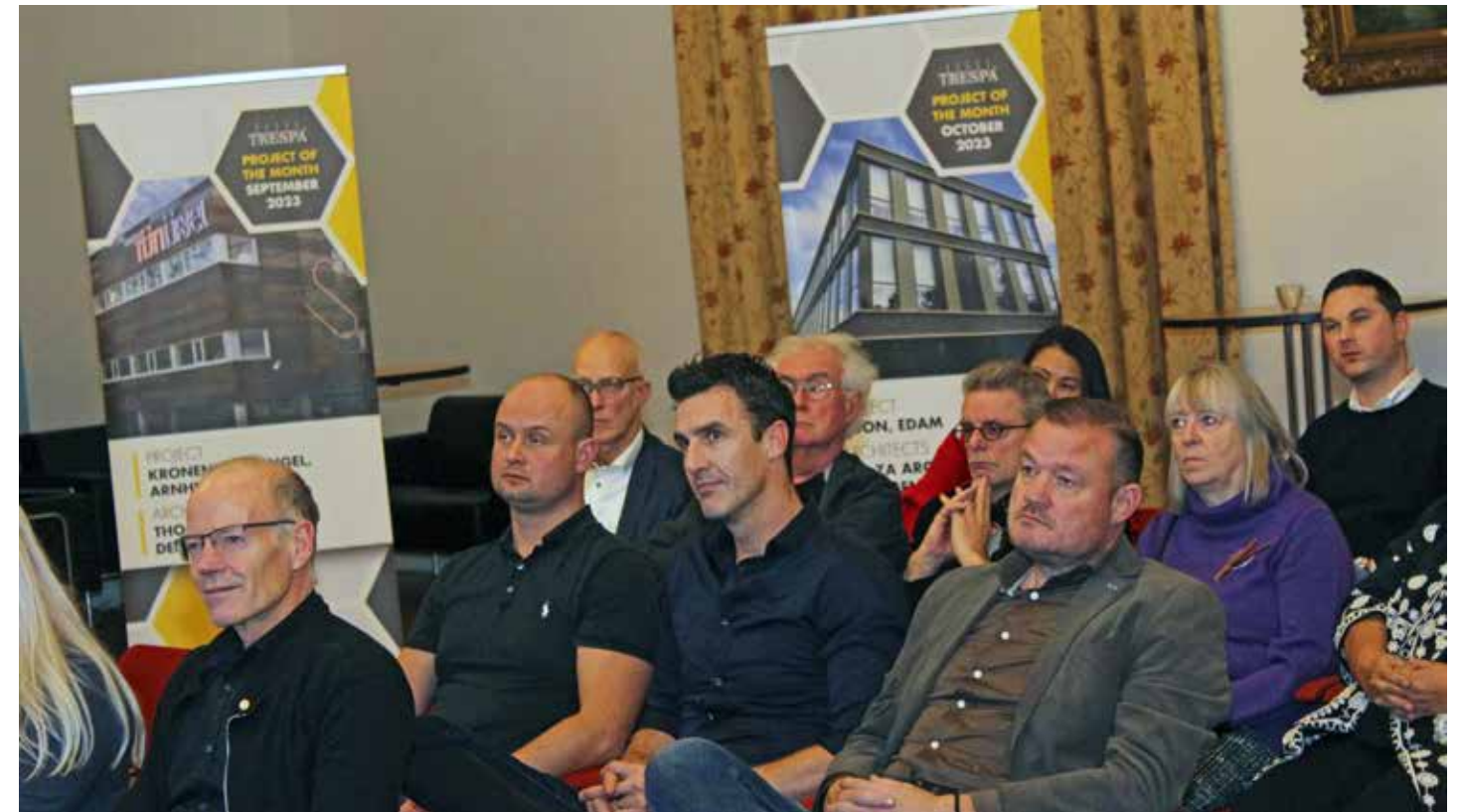
Architecten uit alle delen van Nederland waren naar Putten afgereisd.

evalueren want je kunt een volgend event altijd weer een stukje beter maken, maar deze aftrap van hopelijk een lange reeks Award-uitreikingen was wat mij betreft al meer dan fantastisch.