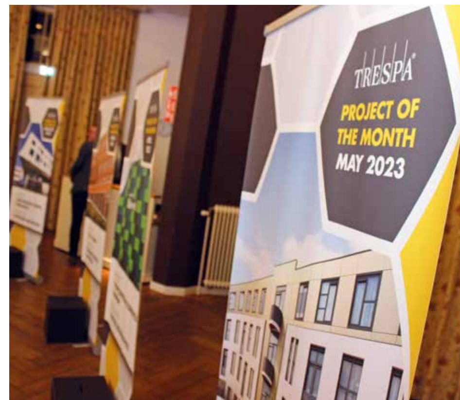
De Award-uitreiking was een optelsom van alle maandwinnaars.

'Er was een goede opkomst van veel architecten uit het land, bijna alle genomineerden waren er'