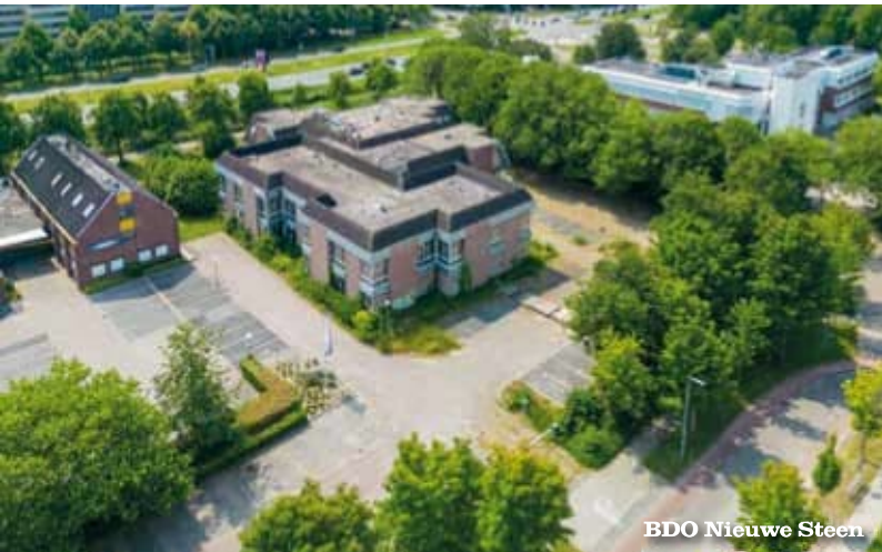
BDO Nieuwe Steen